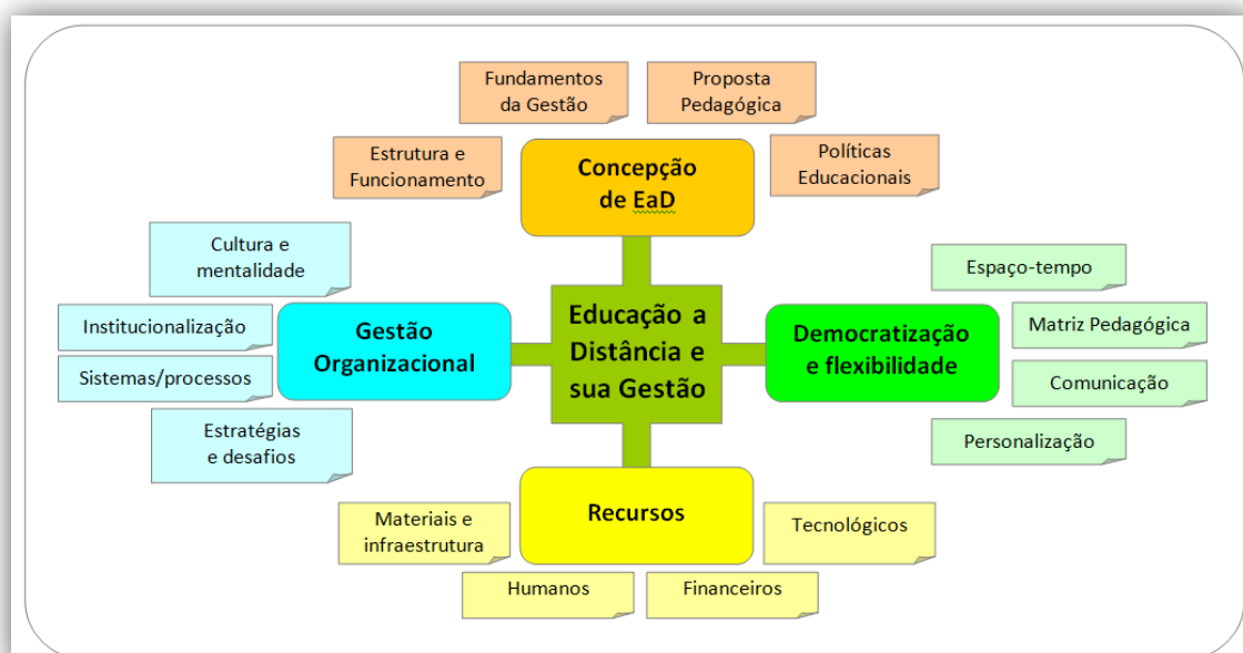
Figura 2. Elementos de análise do processo de gestão da EaD, com vistas à democratização do conhecimento.

Com base em experiências brasileiras e portuguesas com educação a distância, buscou-se compreender nesta investigação os principais desafios da gestão da EaD. Os parâmetros de interesse dessa pesquisa baseiam-se em dilemas de gestores de sistemas de EaD (em termos de gestão de sistemas, concepção de EaD e de proposta pedagógica) e em possíveis benefícios de experiências consolidadas para a gestão da EaD brasileira (planejamento, organização, direção e controle nos processos da EaD). Como pano de fundo, o interesse da investigação foi contribuir para a otimização dos (poucos) recursos (recursos humanos, tecnológicos, financeiros e materiais ou infraestrutura) disponíveis no Brasil para a realização de um programa de formação democrático (baseado na flexibilização dos processos em termos de espaços e tempos da educação, da matriz pedagógica, dos processos comunicacionais etc.), concebido como formação personalizada do ponto de vista dos educandos. A Figura 2 sistematiza esses elementos básicos da investigação, que também são compreendidos como categorias de análise para sistematização dos dados e discussão dos resultados da pesquisa.