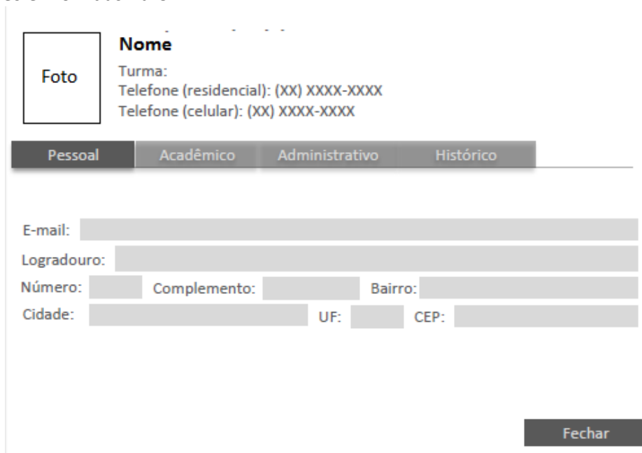
Figura 3. Perfil de um aluno.

A Ouvidoria permitirá que qualquer membro da comunidade UAB/UFSCar possa fazer reclamações, denúncias ou sugestões, com a opção de não se identificar. Este canal proverá ferramentas para que a melhoria contínua seja implantada nos polos de apoio presencial. Através da ouvidoria, será possível potencializar força do grupo (principalmente dos alunos) frente à hierarquia e burocracia que possam cercar as instituições envolvidas na UAB.