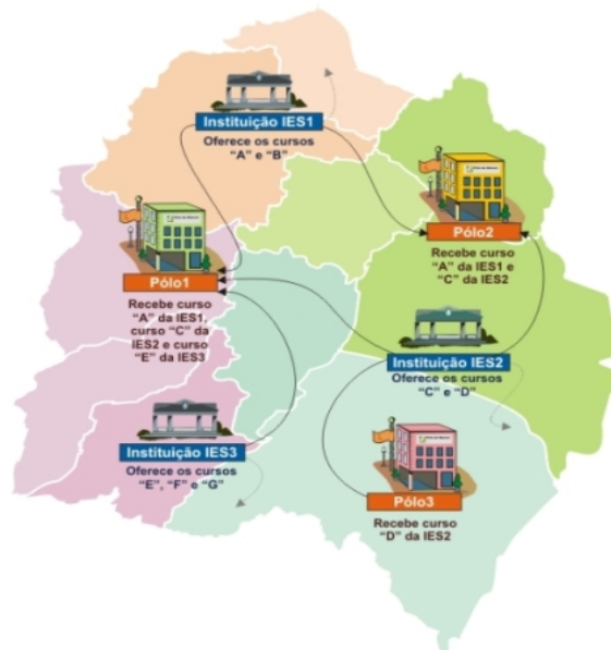
Figura 2. Funcionamento do sistema UAB.

Essa articulação estabelece qual instituição de ensino deve ser responsável por ministrar determinado curso em certo município ou certa microrregião por meio dos polos de apoio presencial. A Figura 2 exhibe esse funcionamento.